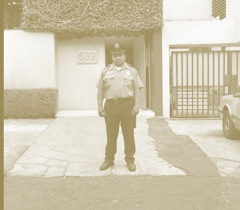
Abbildungen / Images: © Dante Busquets (Titel, S.3 unten, S.4), © Till Budde (S.3 oben), © Jeremy Clouser (S.6)

Deutsches Architektur Zentrum DAZ Bund Deutscher Architekten BDA Köpenicker Straße 48/49 / 10179 Berlin T + 49 30 27 87 99 28 / mail@daz.de / www.daz.de